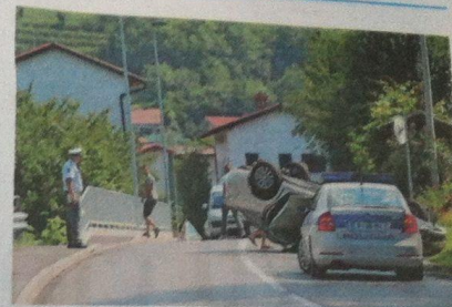
Komaj 20-letni voznik je v soboto v Dornberku končal z avtom na strehi.